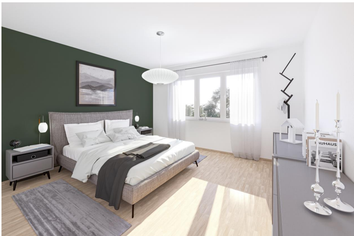
Visualisierung Schlafzimmer Obergeschoss