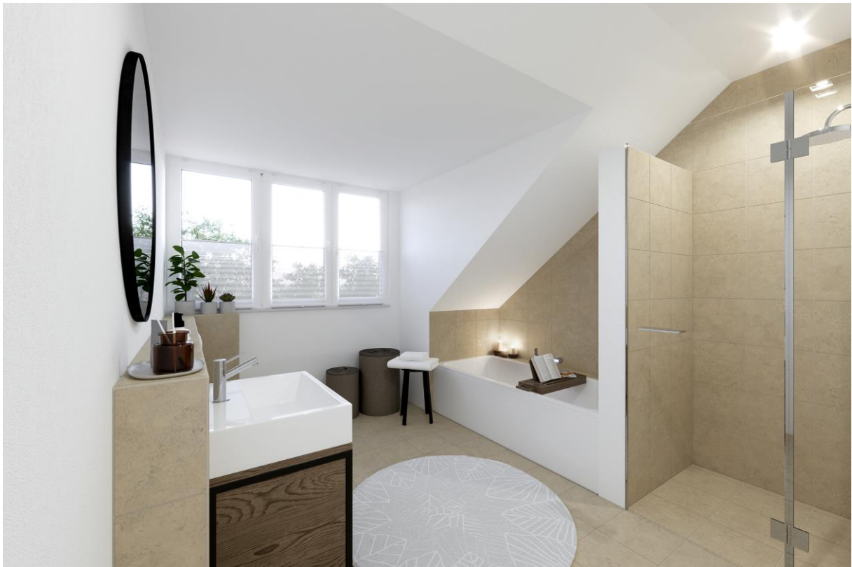
Visualisierung Badezimmer Dachgeschoss