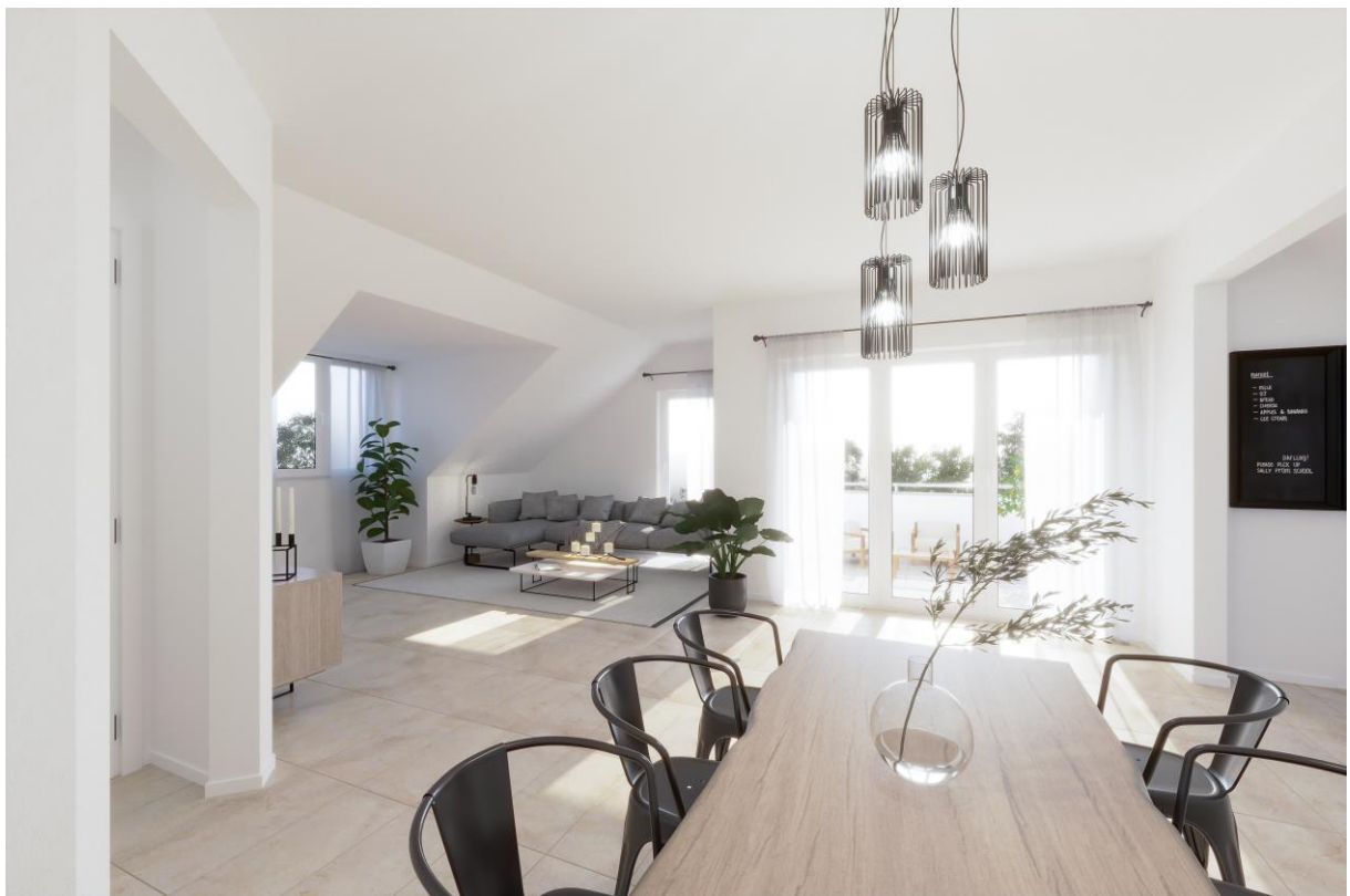
Visualisierung Wohn- Esszimmer Dachgeschoss

Ein besonderes Highlight ist dabei die große Wohnung im Dachgeschoss. Diese verfügt gleich über zwei Loggien und weist eine Wohnfläche auf, die einem Einfamilienhaus nahekkommt. Besonders praktisch und luxuriös fährt der Aufzug direkt in die Wohnung ein und hebt den Wert dieser einmaligen Immobilie nochmals besonders hervor.